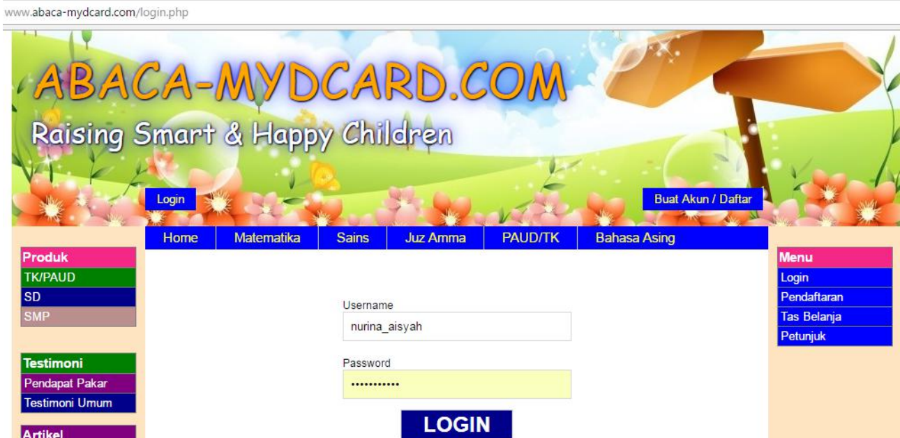
Contoh memasukkan username dan password pada halaman Login

Untuk melakukan login, masukkan data username dan password Anda. Jika Anda belum tahu maka bisa menanyakan ke pengelola abaca-mydcard.com. Pada saat pendaftaran, data-data username dan password juga dikirimkan ke email Anda.