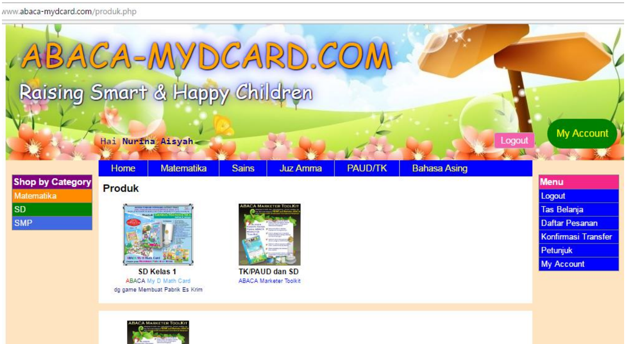
Perhatikan ada tombol My Account dan Logout di sebelah kanan.

Setelah berhasil melakukan login maka akan muncul halaman seperti di bawah ini.